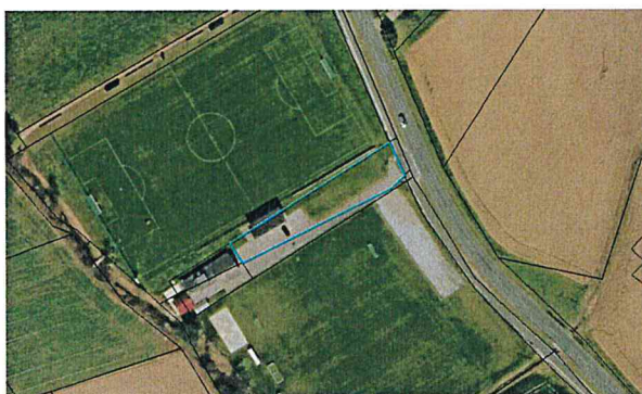
Slika 1: Geografska lokacija obravnavane parcele

Geografko spada območje naselja Grajena v vznožje hribovja JV dela Slovenskih Goric, kjer je obravnavana lokacija objekta umeščena v ravninsko področje Ptujskega polja. Teren je ravninski, kjer se v neposredni bližini obstoječega objekta nahaja potok Grajena.